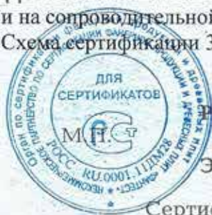
Схема сертификации 3.

ДОПОЛНИТЕЛЬНАЯ ИНФОРМАЦИЯ Место нанесения знака соответствия: на таре (упаковке) и на сопроводительной технической документации.