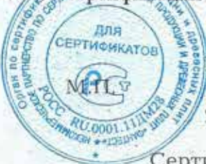
Схема сертификации 3.

ДОПОЛНИТЕЛЬНАЯ ИНФОРМАЦИЯ Место нанесения знака соответствия: на таре (упаковке) и на сопроводительной технической документации.